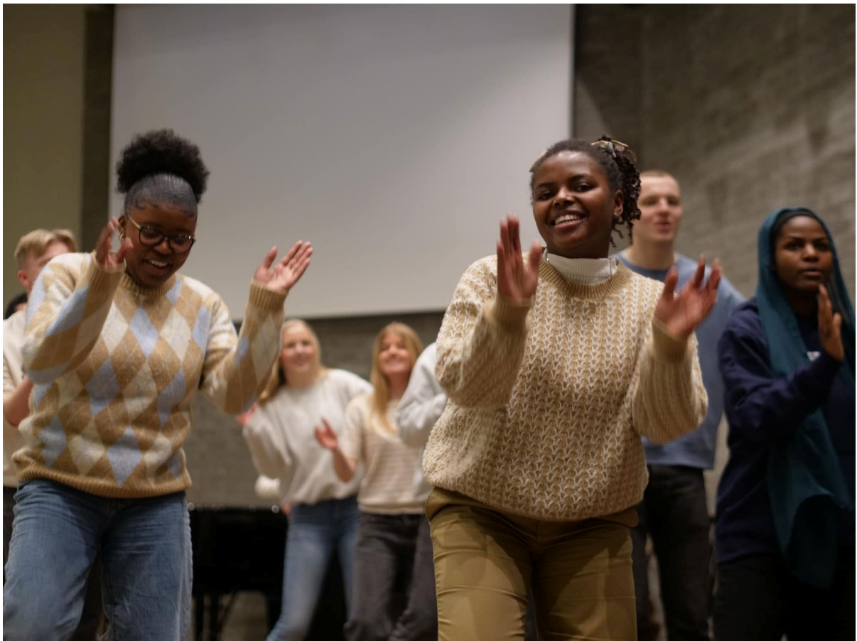
Fra regional ledersamling i Oslo

Årsrapporten sier noe om de tydeligste trendene i kirkesamfunnet, rapporterer på arbeidsplanene og sier noe om hvordan arbeidet i Baptistkirken Norge fungerer, før en i avslutningsordene har et blick framover.