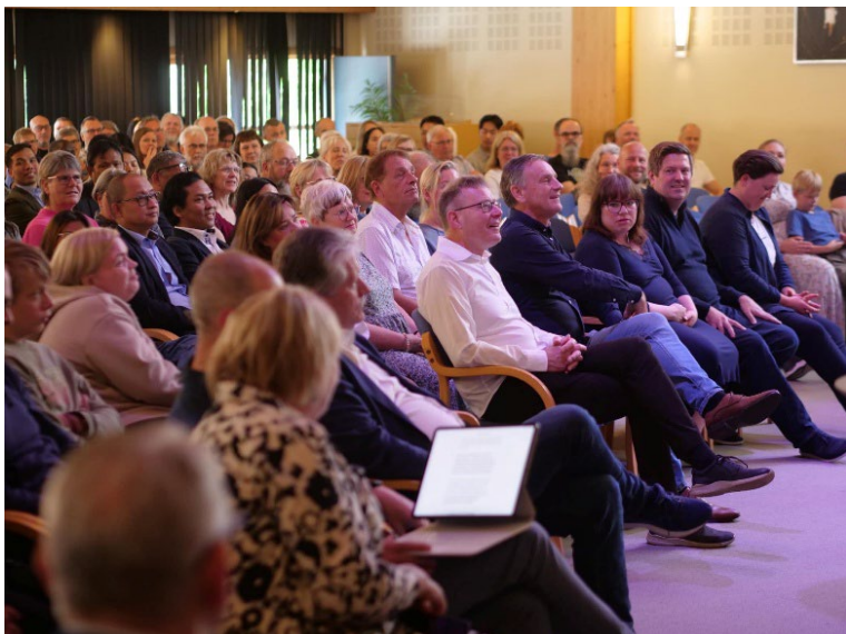
Fra landsmøtet i Skien

Ulik forståelse av bibeltekstene knyttet opp mot likekjønnet samliv har i ulike perioder utfordret fellesskapet og enheten i Baptistkirken Norge de siste 35 årene. Et stort flertall av landsmøtedelegatene sa i 2023 nei til å akseptere at mennesker som lever i et likekjønnet samliv kan ta del i lederskap i en kirke. I forlengelsen av dette ble det vedtatt at en kirke kunne suspenderes om den gjorde valg på tvers av landsmøteflertallets ønsker. En suspensjon som skulle vare til kirken gjorde om valget som hadde skjedd.