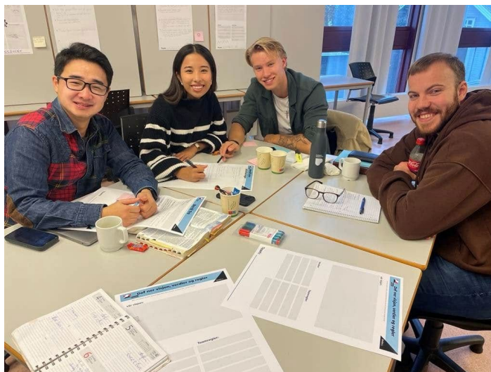
Ledergruppa i kirkeplanten Crosspoint på M4 ns kurs