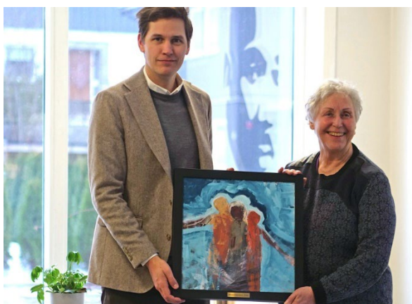
Bestemødre for fred fikk Ikkevoldsprisen i 2024. Den ble overrakt av Jørgen Vatne som leder Nobelkomitéen

I løpet av 2024 har en mottatt 11 varsel, alle knyttet mot samme sakskompleks.